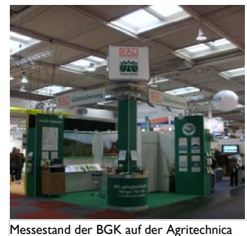
Messestand der BGK auf der Agritechnica

Die Broschüre der BGK zur „Organischen Düngung“ aus der BGK-Serie zur guten Fachlichen Praxis fand regen Absatz. (WE)