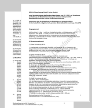
Lesefassung der BioAbfV nach BR-Änderungen