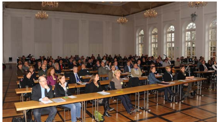
Mitgliederversammlung der Bundesgütegemeinschaft Kompost e.V. am 1. Dezember 2011 in Fulda.

Kritisiert wird v.a., dass der Verwaltungsaufwand, etwa für Bodenuntersuchungen nach § 9 Absatz 2 BioAbfV, enorm erhöht wird. Von solchen Untersuchungen waren gütegesicherte Komposte und Gärprodukte bislang aus gutem Grunde befreit.