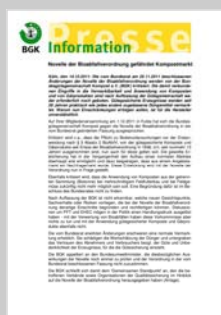
Pressemitteilung der BGK