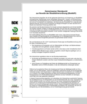
Gemeinsame Erklärung der Verbände